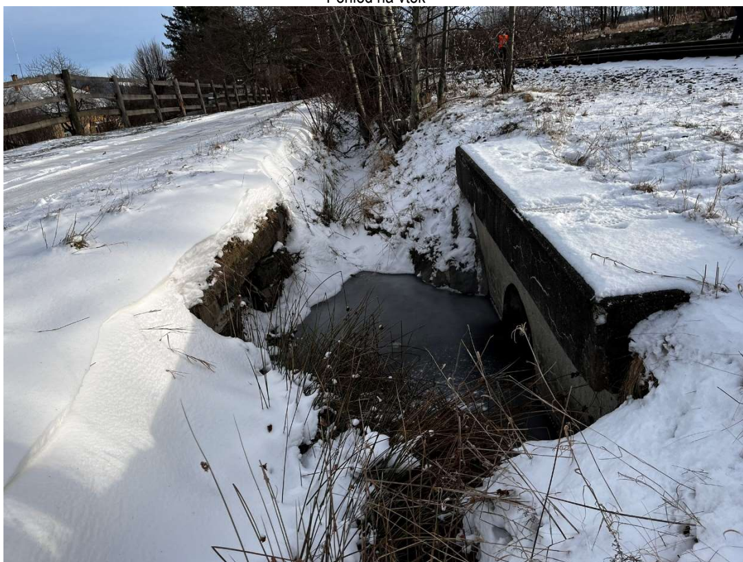
Pohled na výtok