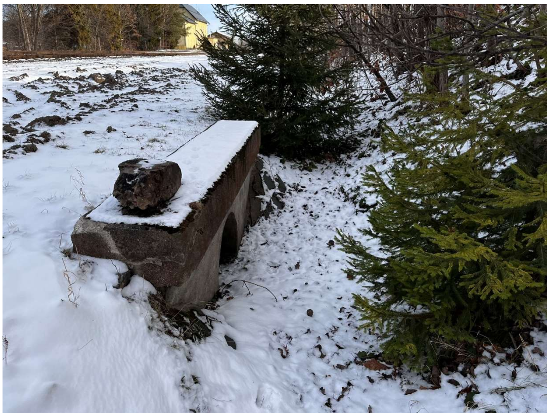
Pohled na vtok